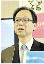
移住者数の実績を公表した佐藤樹一郎知事