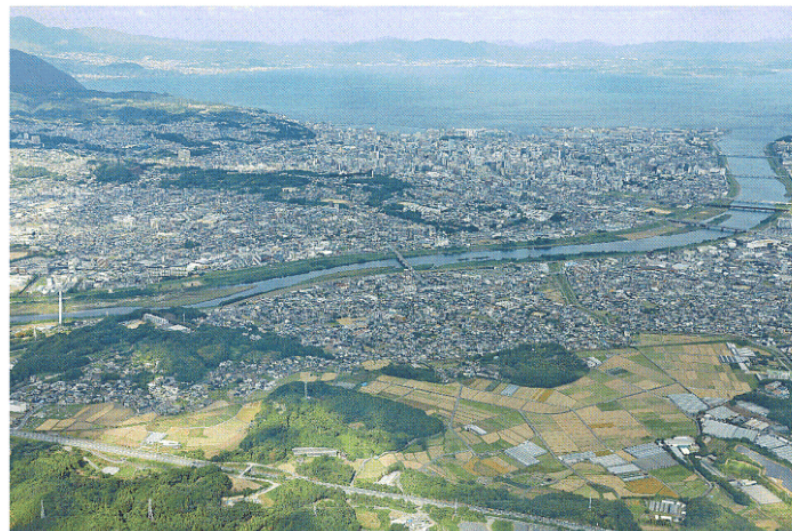
県内への移住者数は年々増加している。昨年10月、大分市上空から

元の住所は福岡県が27%で最も多かった。首都圏(1都7県)が21%、福岡以外の九州・沖縄各県が15%、関西地域(2府4県)が14%。25年度に寄せられた移住の相談件数は903件(大分県の把握分)で、24年度の692件から大幅増。26年度はオンラインを含めて30回程度の相談会を開く。移住の誘致と併せ、県は人手不足が深刻な業種の人材確保にもつなげたい考