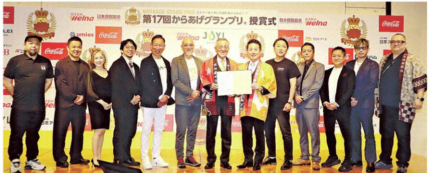
「カラアゲシティプロジェクト」の共同宣言をした中津、宇佐両市の唐揚げ専門店代表者ら(中津市)