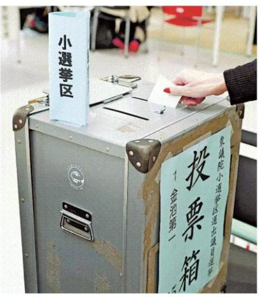
投票する有権者 2月8日、大分市

県全体の投票率は58・33%で、40代前半までの年齢層はいずれも下回った。10～20代の若年層では、年齢別で18歳の54・98%が最も高く、受験シーズンと重なったにもかかわらず前回と比べて9・96ポイント上がった。