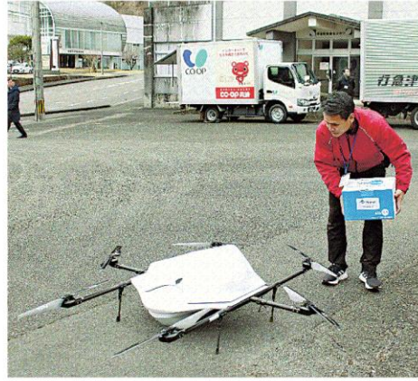
集まった荷物をドローンに積み込む関係者＝佐伯市宇目保健センター前

うというもの。実証実験にはトラックとドローンを利用したスマート物流を進めるネクストデリバリー（山梨県小菅村）を中心に、物流大手のセイノーホールディングス（岐阜県大垣市）、コープおお