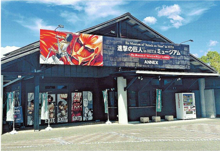
開館して1年を過ぎた「進撃の巨人 in HITA ミュージアムANNEX」=日田市高瀬

【日田】日田市高瀬の「進撃の巨人 in HITA ミュージアムANNEX」が開館して1年を過ぎた。作者の諫山創さんの出身地(同市大山町)にある「進撃の巨人 in HITAミュージアム」の別館として、昨年8月20日にオープン。人気漫画の世界観に触れようと国内外からファンが集まり、盛況を博している。