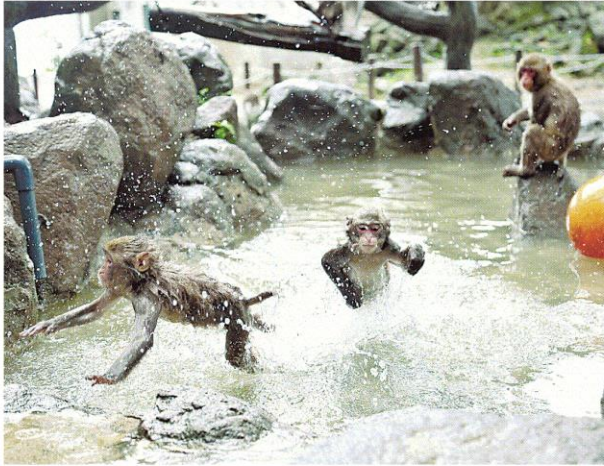
高崎山自然動物園

【大分】大分市神崎の高崎山自然動物園に、夏恒例の「おさるのプール」が登場した。8月31日まで元気いっぱいの子ザルたちが水遊びを楽しむ姿を見ることが出来る。 同園は毎年、気温が高くなる