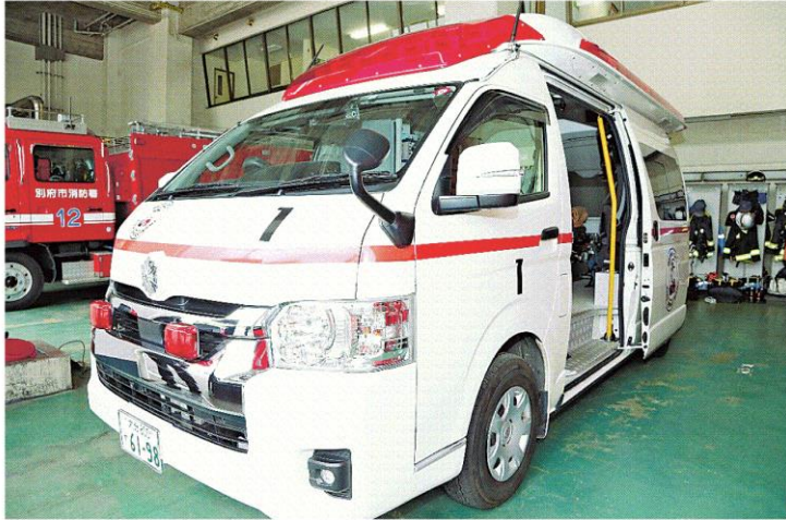
別府市内で運用する救急車＝市消防本部