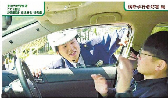
〔上〕横断歩行者妨害編の一場面。横断歩道では歩行者優先であることを説明している