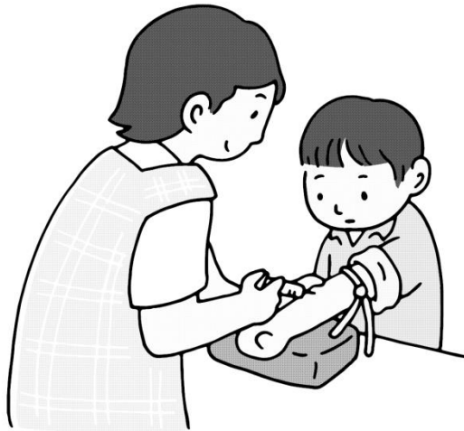
小5を対象にした血液検査の項目にピロリ菌検査を追加

【大分】大分市教委は本年度から、市内の小学5年生を対象に胃がんの主な原因となっているヘリコバクターピロリ(ピロリ菌)の検査を実施する。小5の希望者を対象に毎年実施している血液検査(すこやか検診)の検査項目に追加する。県内では別府・臼杵両市が取り組んでいる。