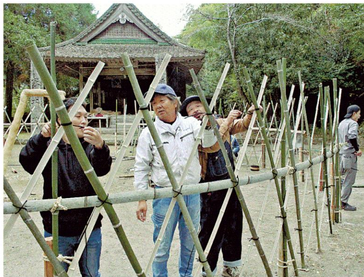
雲八幡宮の境内で、地域の年長者が教えながら、竹を編んで結界をつくる若手＝中津市宮園

湯立神楽は、木と竹を組 み赤土を塗った脚の上に釜 を乗せ、まきで湯を沸かし て舞う。通常の神楽に続き 終盤の六番が湯立神楽。最 後は、氏子らが湯立てのお き火の上をはだして歩く荒 行「火渡り」で納める。