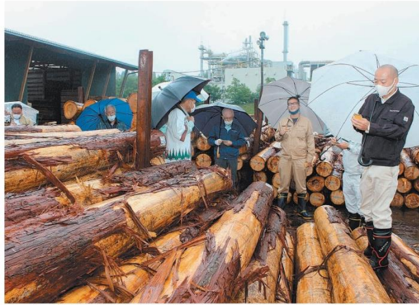
ヒノキの競りに参加する製材業関係者ら=24日、日田市、撮影・佐藤章史