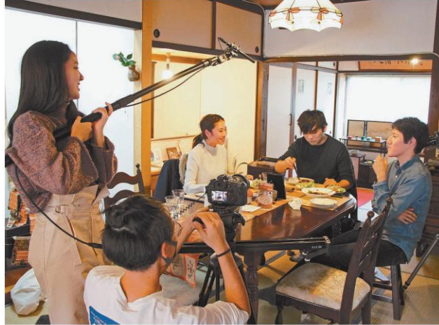
茶房たかさきで最終話の撮影をする学生＝別府市朝見

【別府】温泉に漬かって心身を癒やす湯治文化を若い世代にも紹介しようと、別府市の立命館アジア太平洋大（APU）の学生団体「Youth since 2019（ユース）」がウェブドラマを製作している。タイトルは「to BE（トゥービー）」。