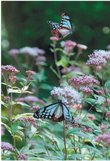
フジバカマの周囲を飛び交うアサギマダラ

【竹田】竹田市久住町のくじゅう花公園で秋の花が見頃を迎えている。園内ではマリゴールドやベゴニア、セイヨウギクなどが咲き誇る。フジバカマには干