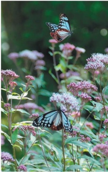
フジバカマの周囲を飛び交うアサギマダラ

【竹田】竹田市久住町のくじゅう花公園で秋の花が見頃を迎えている。園内ではマリーゴールドやベゴニア、セイヨウギクなどが咲き誇る。フジバカマには千匹以上を旅するチョウアサギマダラが蜜を吸うため飛来し、来園者を楽しませている。