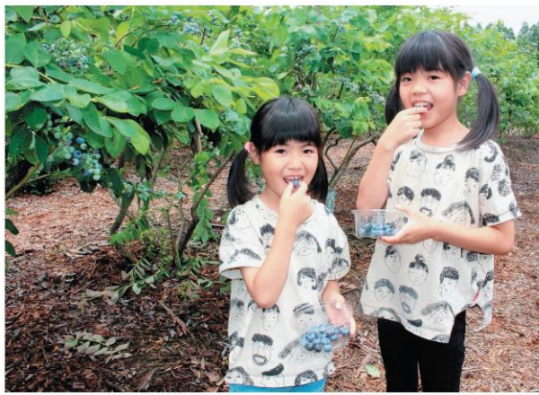
九重町のベリージュファームでブルーベリーを食べる子ども