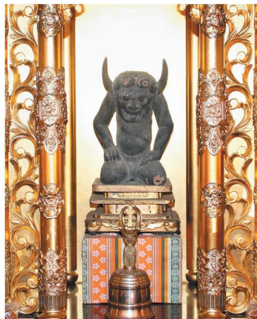
文殊仙寺にある鬼大師の像＝国東市国東町大恩寺