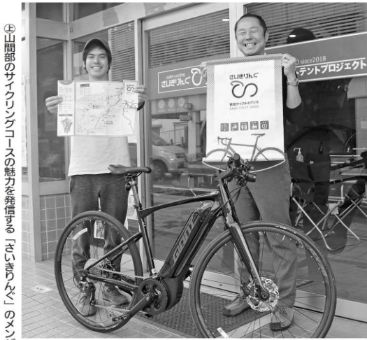
④ 山間部のサイクリングコースの魅力発信する「さいきりんぐ」のメンバーが制作したマップ。佐伯市