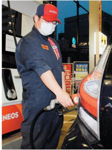
車に給油するガソリンスタンドの従業員=18日午後、大分市内