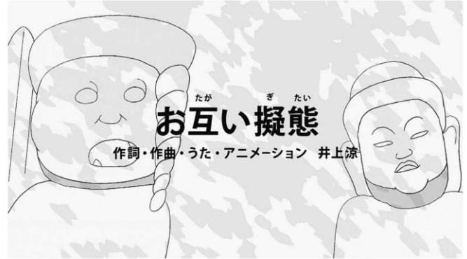
「お互い擬態」のオープニング映像（上）と一場面