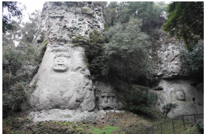
平安時代末期の作といわれる大日如来（右、約6・7㍎）と不動明王（左、約8㍎）