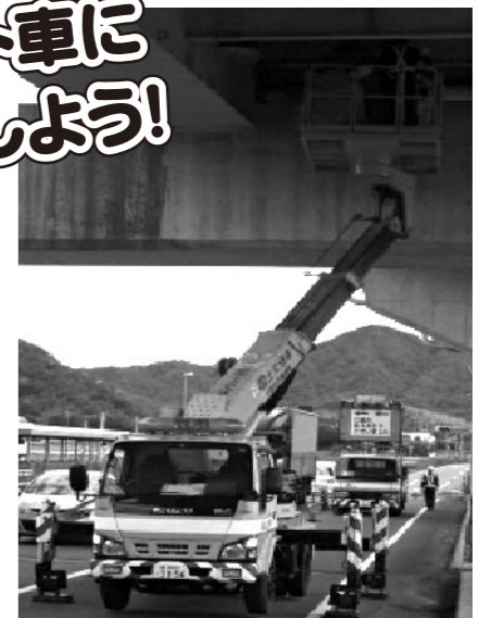
スーパーデッキを用いた近接目視点検

「道サポ」体験見学学習会では、橋などの施設の維持管理についての講演会と府内大橋の体験見学を予定しています。